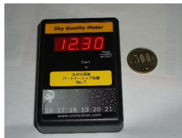
スカイクオリティメーター

測定は、頭の真上(天頂)に向けて、ボタンを押すだけで瞬時に夜空の明るさが表示されます。同一地点で3回計測します。