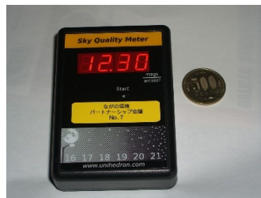
スカイクオリティメーター

測定は、頭の真上(天頂)に向けて、ボタンを押すだけで瞬時に夜空の明るさが表示されます。同一地点で3回計測します。